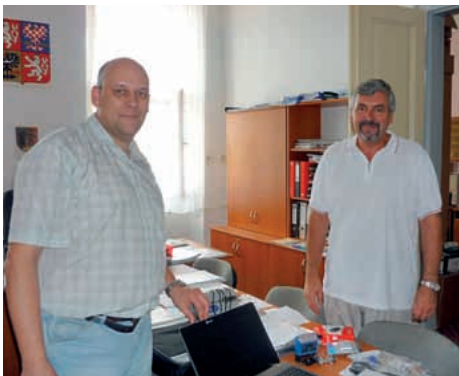
Předávání IT techniky v ZŠ Bystré