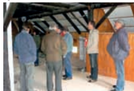
CH 3 000, s.r.o., Březiny