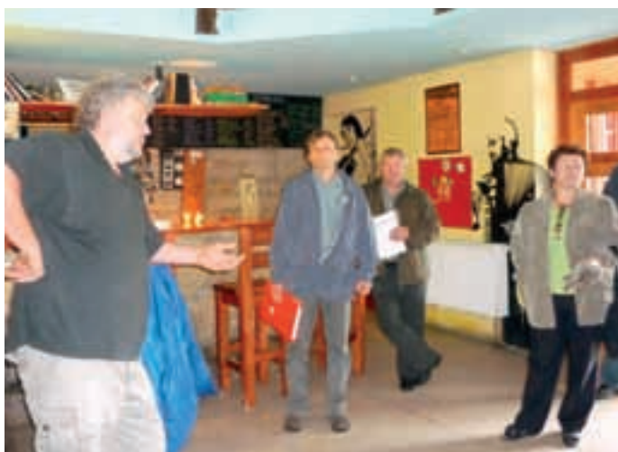
Divadelní spolek Tyl