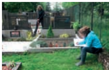
Mapování hřbitovů studenty Masarykovy univerzity

V první fázi realizace projektu, v průběhu měsíců června až září, bude na jednotlivých hřbitovech provedena studenty VŠ evidence, kontrola a doplnění současných plánků a schémat, fotografování jednotlivých hrobových míst a opisy údajů z náhrobků. Tyto údaje budou zaneseny do pra-