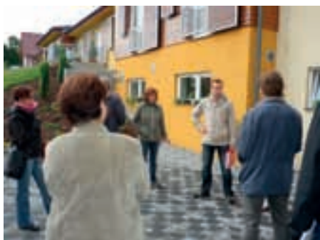
Svazek obcí AZASS