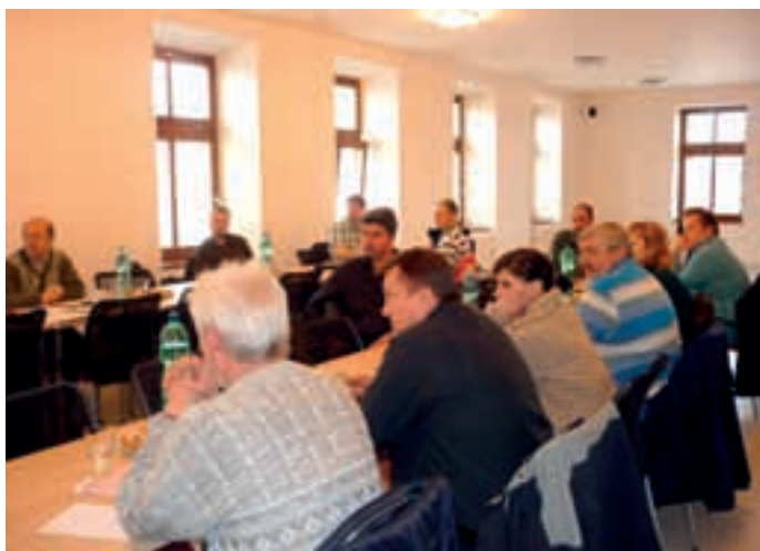
Školení žadatelů 24.4.2012

Všechny podané projekty prošly při odevzdávání kontrolou úplnosti. Poté následovaly kontroly správnosti a administrativní kontroly a žádosti o doplnění některých nejasných informací v projektech jednotlivých žadatelů. Výběr projektů k financování začal dne 5.6.2012 prezentacemi projektů na místě realizace projektu, které představili zástupci jednotlivých žadatelů. Každý z žadatelů dostal cca 10 minut na prezentaci projektu a zodpovězení dotazů členů výběrové komise.