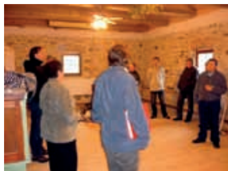
Občanské sdružení Květná Zahrada