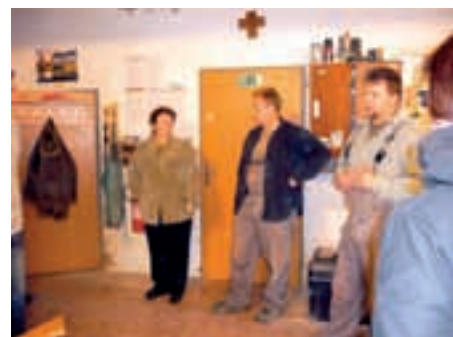
Boštík & synové, s.r.o.