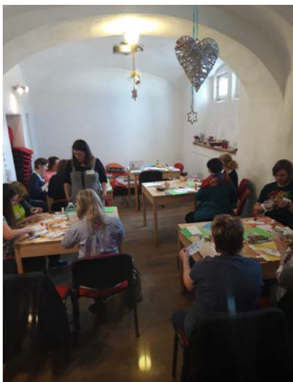
Workshop - Lapbook 17.5.2019

Všechny informace, výstupy, pozvánky a zápisy týkající se realizace MAP II budou pravidelně zveřejňovány na: www.maspolicsko.cz a FCB profilu: MAP II Poličsko. Případné dotazy či náměty můžete zasílat na: info@maspolicsko.cz , map@maspolicsko.cz