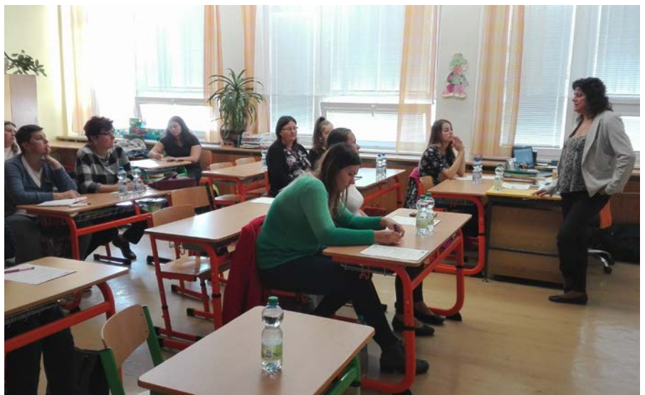
Matematická gramotnost v předškolním vzdělávání 19. 9. 2019